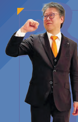
令和6年度 日本 YEG 会長

交流、地域貢献、ビジネス交流、未来提言などの活動を通じて、地域から必要とされる組織であり続けるために団結し、共に YEG 活動に邁進して参りましょう。