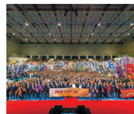
美の国あきた大会の様子

秋田県連会員大会、東北ブロッ ク大会、全国大会など、毎年全 国各地で様々な大会が開催され ます。秋田 YEG ではそれら大会 に積極的に参加し、秋田県内だ けではなく全国の会員と交流を しています。