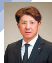
令和6年度 秋田 YEG 会長 株式会社新ルーフ工業 代表取締役

商工会議所活動の一翼を担う組織としての自覚を持ち、親会事業の理解促進と交流を図ります。そして地域の様々な課題を検証し、政策提言への道筋を創る YEG 活動をしていきます。